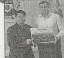
САРАЂЕ Мо и Савић

Ово је била једна од највећих инвестиција Општине Војковац, која је настала као резултат унапређења сарадње Кине и Србије, а у прилог томе иде и конструктивни дијалог који су представници Општине водили са кинеским инвеститором. ■ Г. Н.