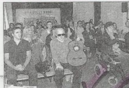
ДРУЖЕЊЕ На сајму је било и музика