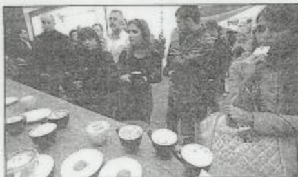
ПОВОДА Чак 26 излагача представило је своје производе.

УПОЗОРЕЊЕ да кафе садржи кофеин, те да се не конзумира превисше, било је упућено онима који нису могли да се отргну мирису и укусу различитих врста овог напитка. Пред кафе и чајева, бесплатно се могло дегустирати воће уроњено у чоколаду, донаоци ратлуца београдске бомбонерије, а за оне који претерају, вода је била доступна на спом корак.